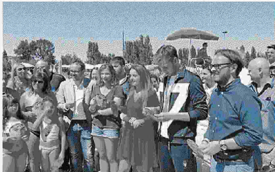
Paltrinieri in piscina a Carpi. Sotto, Dorando Pietri e Greg con i premi

L'IDEA del Comune è una festa per Greg che ricordi la calorosa accoglienza della cittadinanza per Dorando Pietri, con tutte le società sportive del territorio, le polisportive, associazioni e la banda. Al campione vincitore della medaglia d'oro alle Olimpiadi di Rio de Janeiro nei 1500 metri stile libero, il sindaco consegnerà la più alta onorificenza prevista dal regolamento delle civiche benemerenze: le chiavi della città. L'evento inizierà alle 21.45 e vedrà sul palco Gregorio Paltrinieri assieme a Pierluigi Senatore di Radio Bruno. A partire dalle 22 il giornali-